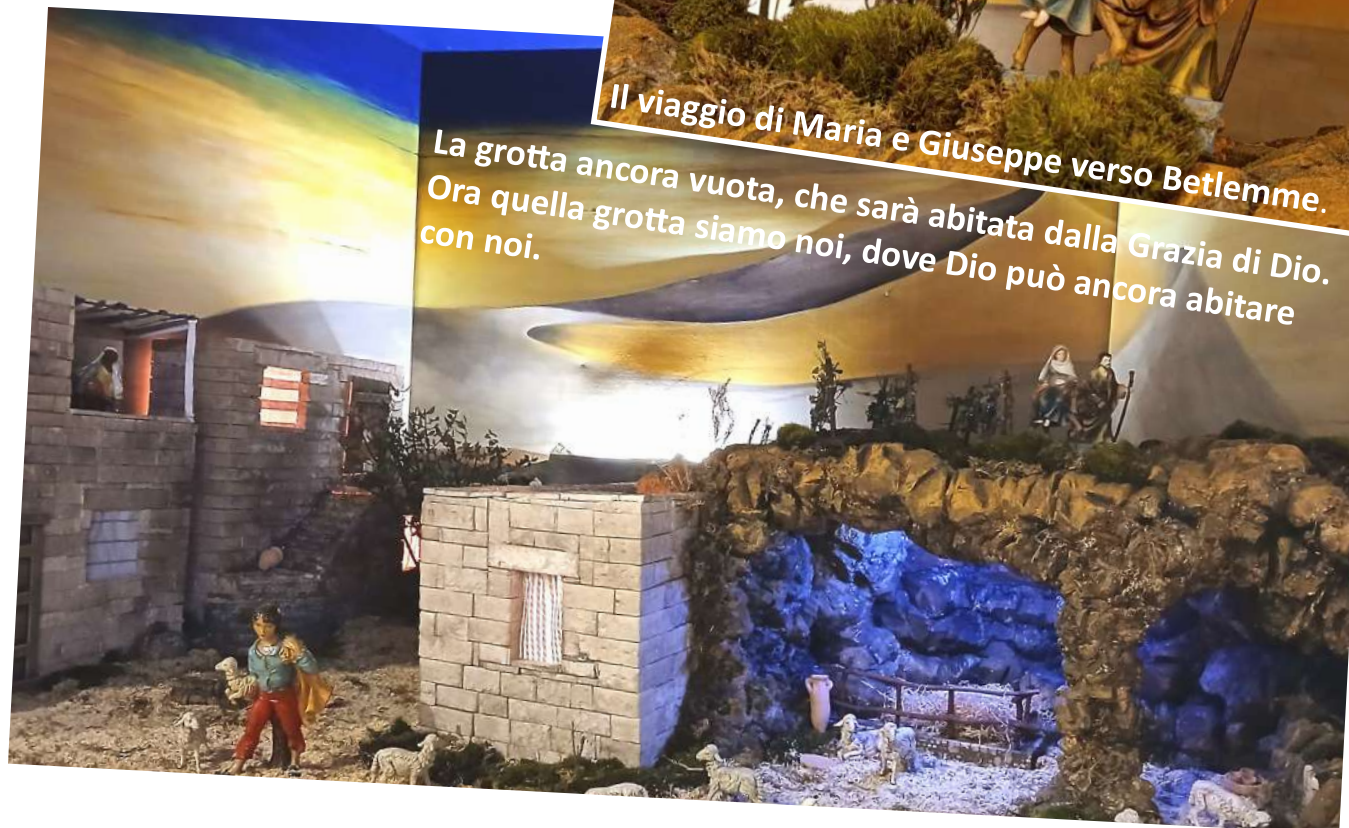
La grotta ancora vuota, che sarà abitata dalla Grazia di Dio. Ora quella grotta siamo noi, dove Dio può ancora abitare con noi.