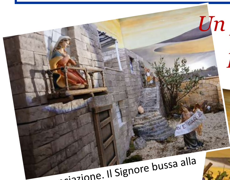
L'annunciazione. Il Signore bussa alla nostra porta.

Un presepe "in cammino" per "abitare" il mondo