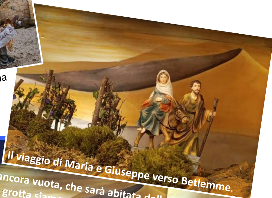
Il viaggio di Maria e Giuseppe verso Betlemme.

Un presepe "in cammino" per "abitare" il mondo