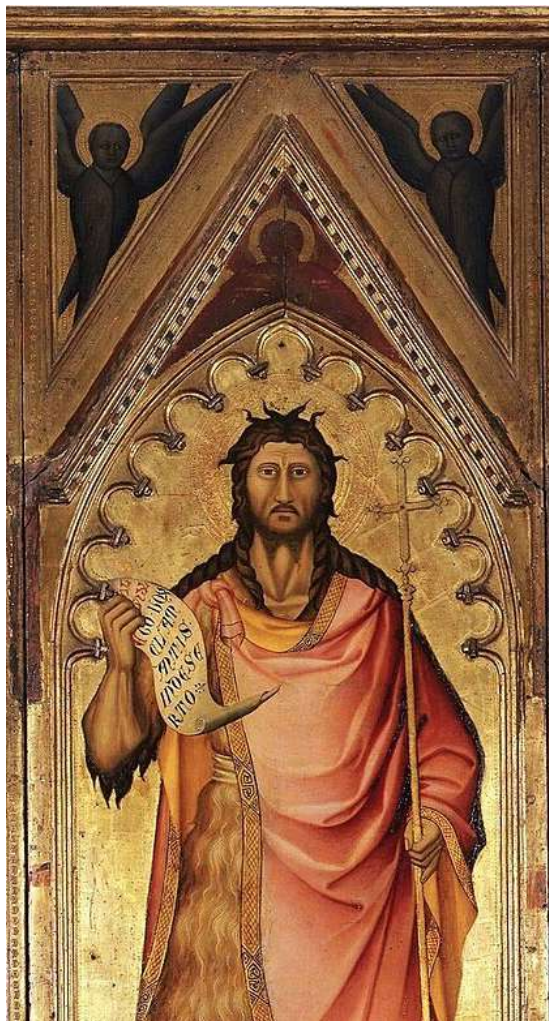
Giovanni del Biondo, San Giovanni Battista , 1365-70, Firenze, galleria degli Uffizi