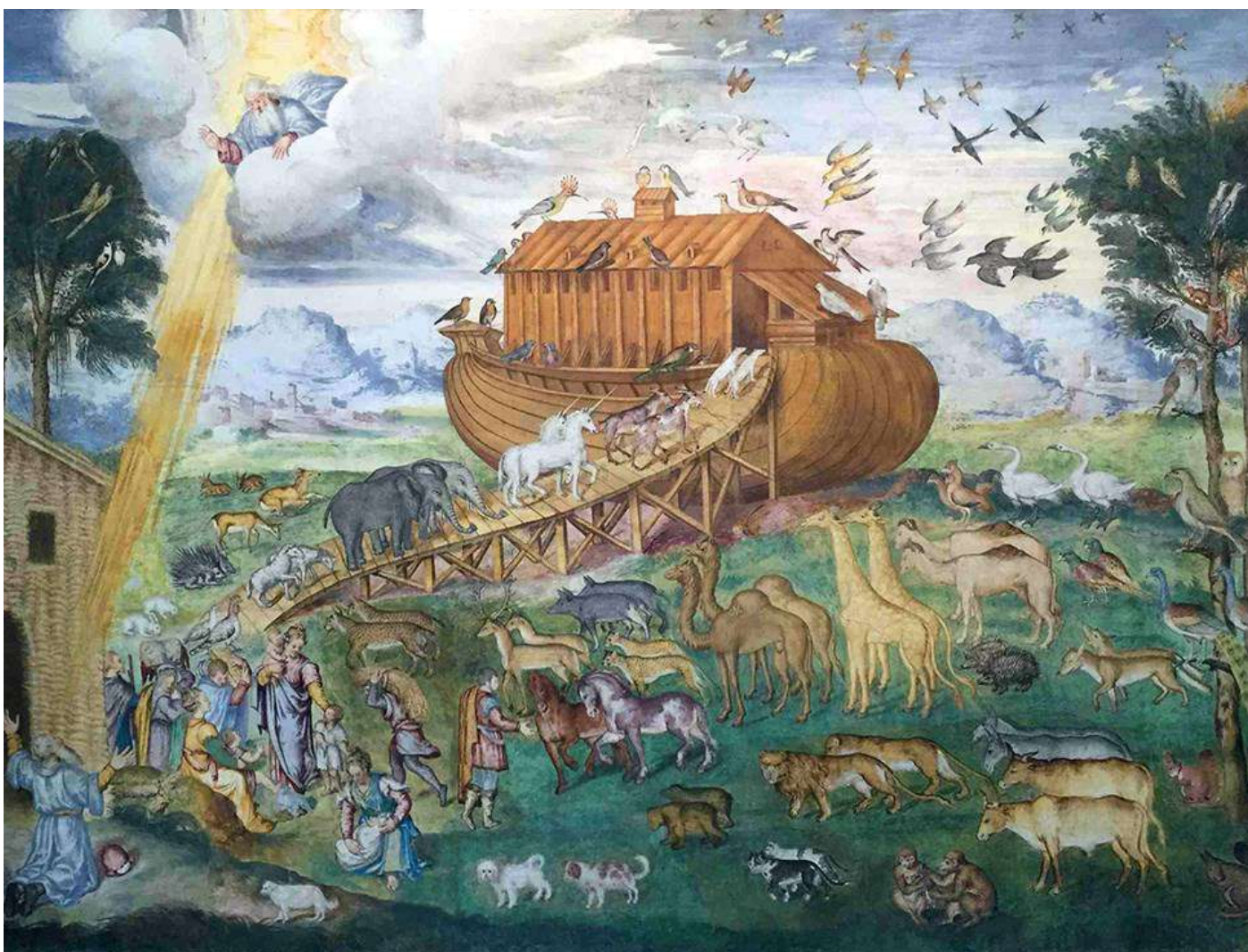
Aurelio Luini, Storie dell'Arca di Noè , Milano, chiesa di San Maurizio al monastero maggiore

Famosissimo, ma forse conosciuto solo superficialmente, è il racconto mitologico dell'Arca di Noè, che troviamo nella prima lettura e citato anche da Gesù nella pagina di Vangelo di questa domenica.