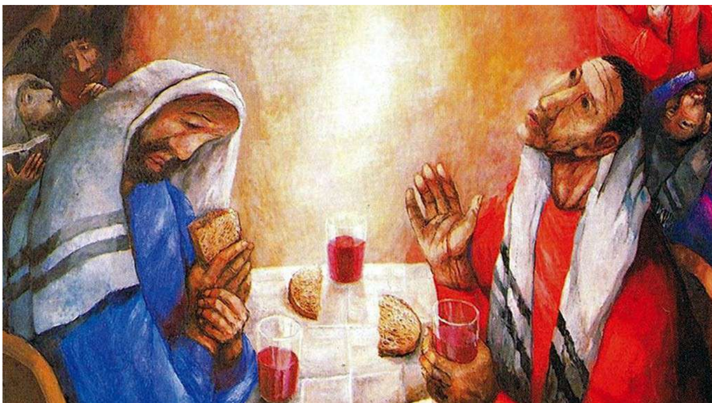
Sieger Köder, Cena in Emmaus (part.) , 1986, Chiesa Mater Dolorosa, Rosenberg (Germania)

Il vangelo di questa settima domenica di Pasqua ci offre uno dei quadri più belli tra tutti i racconti delle apparizioni di Gesù risorto ai discepoli: la cena in Emmaus. Tra l'altro capita proprio a proposito nel giorno in cui celebriamo la Messa di prima comunione per ventidue nostri ragazzi e ragazze.