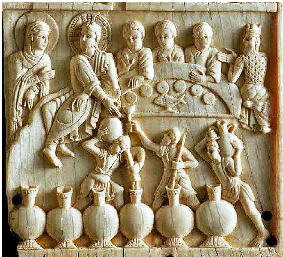
Le nozze di Cana , tavoletta di avorio, sec X, Museo diocesano di Salerno

È un appuntamento fisso: la seconda domenica dopo l'Epifania ci presenta il famoso episodio delle Nozze di Cana.